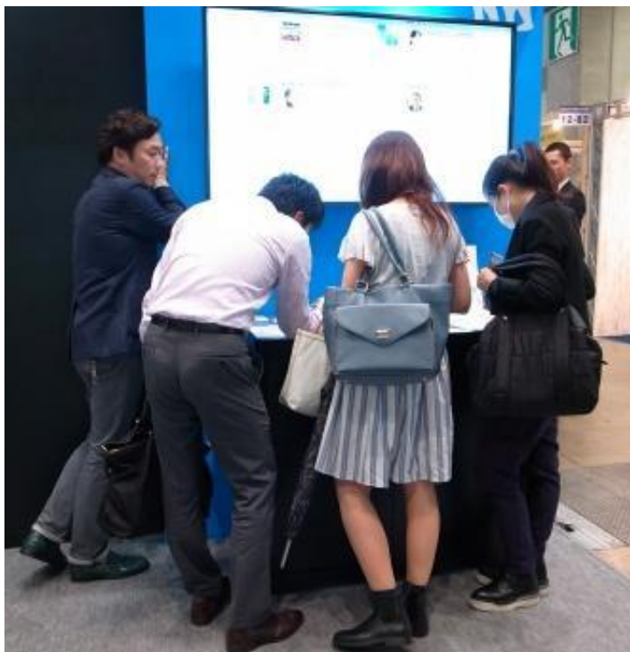
実際に操作をするお客さま