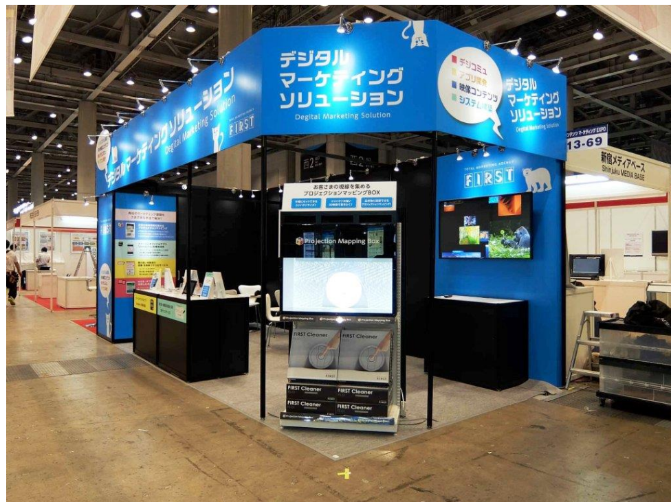
出展ブースでは、4つのメインコンテンツの紹介を実施