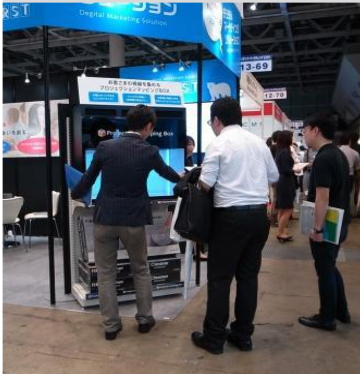
商品説明をする担当者